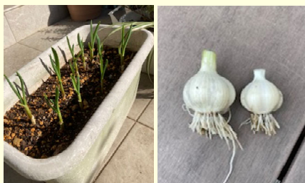
にんにくとれました。

スーパーに買い出しに行ったり、庭でやっているプランター野菜を眺めたり、天気が良ければ洗車したり。あまり趣味らしいものがないんです（笑）。出かける機会も減ってしまったので、運動不足は否めません。たまに家の前で縄跳びをやっていて、子供と二重飛び何回連続で飛べるか競争してます。結構回数伸びてきています。