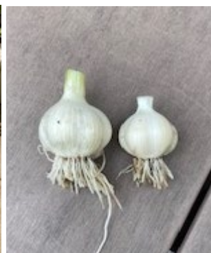
にんにくとれました。