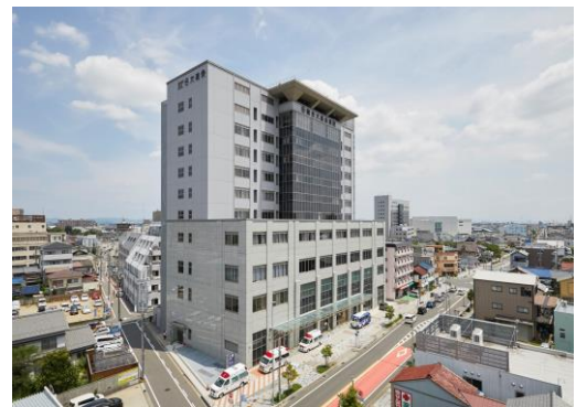
(総合大雄会病院 南館)