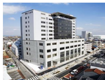
(総合大雄会病院 南館)