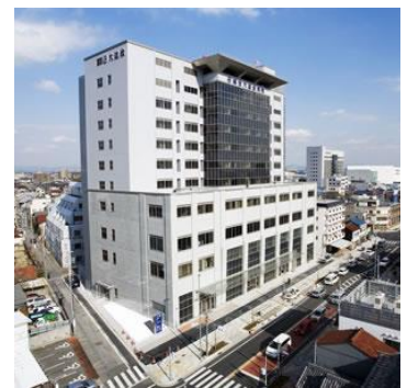
(総合大雄会病院 南館)